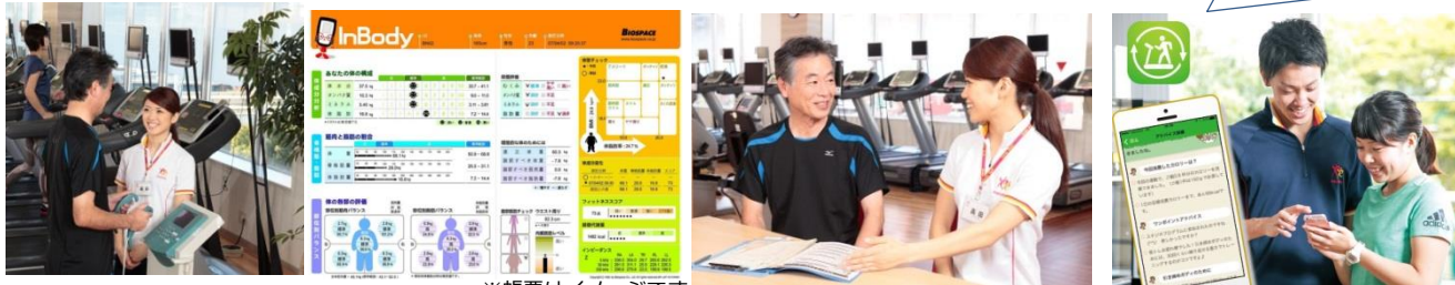
※帳票はイメージです。

「カラダかわるNavi」の バーチャル管理栄養士 があなたの目標達成に向けていつも 身近でアドバイス ！ クラブに行かない日も、モチベーションアップに！