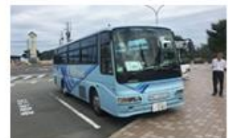
⑤ホテル専用バスがお待ちいたしております。 ※写真のバスと異なるカラーリングのバスもございますので、お気をつけください。