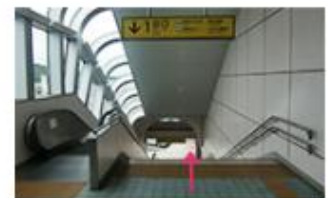
③1階へ降りてください。