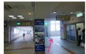
②1番出口へお向かいください