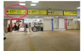
①近鉄改札口を出て左へ