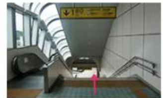
③1階へ降りてください。