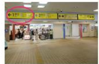
①近鉄改札口を出て左へ