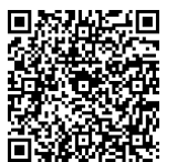
詳しい取り組みはこちら