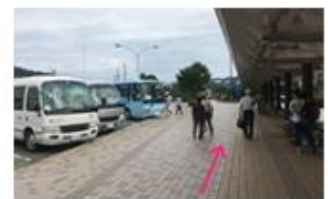
④送迎バス乗り場へお進みください。