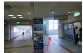
②1番出口へお向かいください