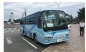
⑤ホテル専用バスがお待ちいたしております。 ※写真のバスと異なるカラーリングのバスもございますので、お気をつけください。