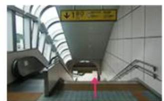
③1階へ降りてください。