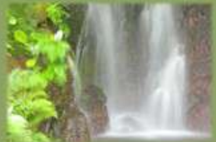
たまだれ 玉簾の瀧